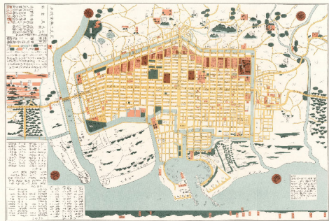
文久改正堺大絵図

町の周囲にめぐらせた堀のことをいいます。中世の堺は国際貿易都市として繁栄しました。「会合衆」と呼ばれる豪商たちが、戦乱から町を守り、住民の自治を保つために堀をめぐらせた「環濠都市」を形づくりました。大坂夏の陣で豊臣方に焼き討ちにあいますが、徳川幕府の都市計画(元和の町割り)のもと、復活します。現在は、内川・土居川・土居川公園に囲まれた南北3km、東西1kmにおよぶエリアを“環濠エリア”と呼んでいます。今も江戸時代～戦前の建築物やまちなみの一部が残されており、400年以上前から続く地域の歴史に思いをはせることができます。